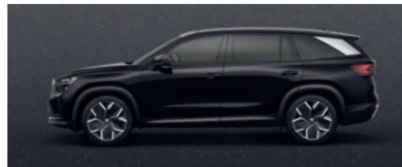
Čierna Magic metalíza