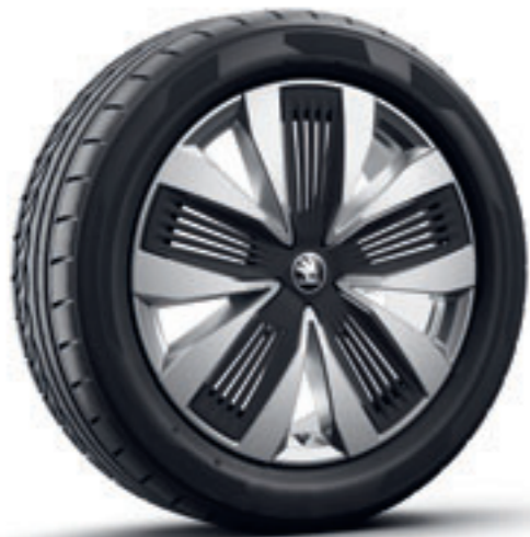
Strieborné 19" disky Talgar Aero z ľahkej zliatiny s čiernymi krytmi Aero