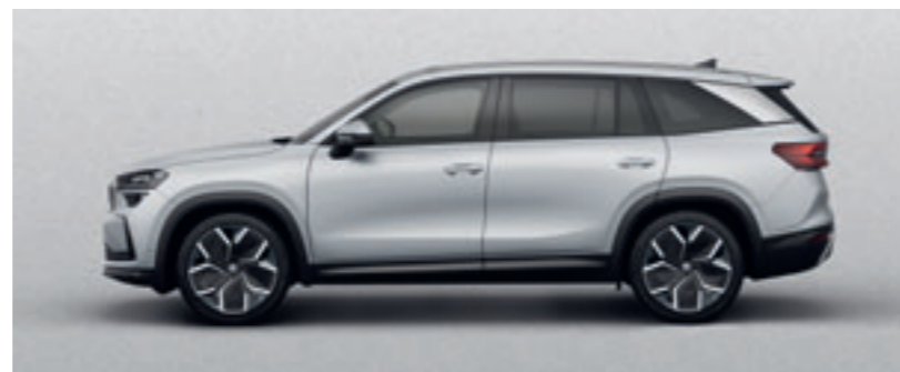
Strieborná Brilliant metalíza