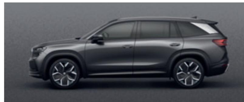
Sivá Graphite metalíza