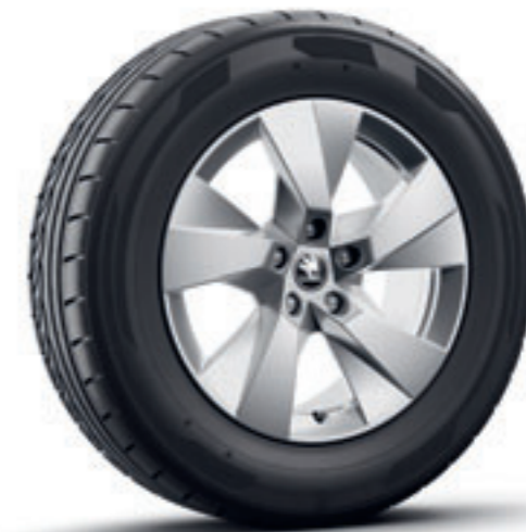
Strieborné 17" disky Paget Aero z ľahkej zliatiny