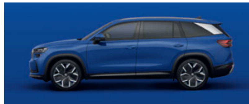
Modrá Energy Uni