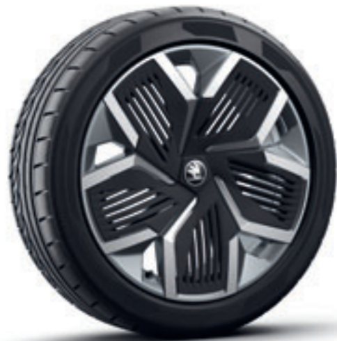
Antracitové 20" disky Rila Aero z ľahkej zliatiny s čiernymi krytmi Aero