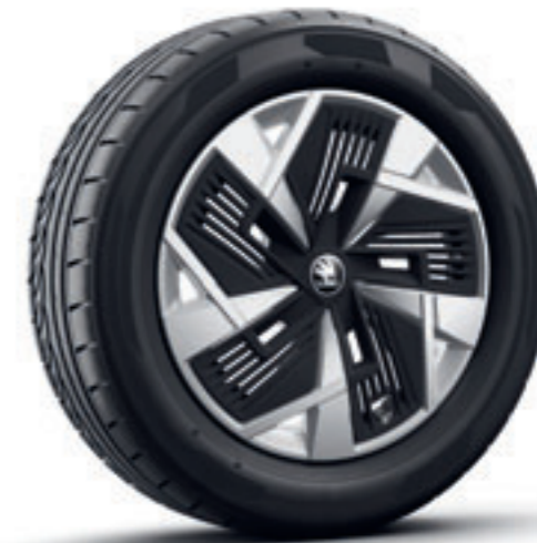
Strieborné 18" disky Mazeno Aero z ľahkej zliatiny s čiernymi krytmi Aero