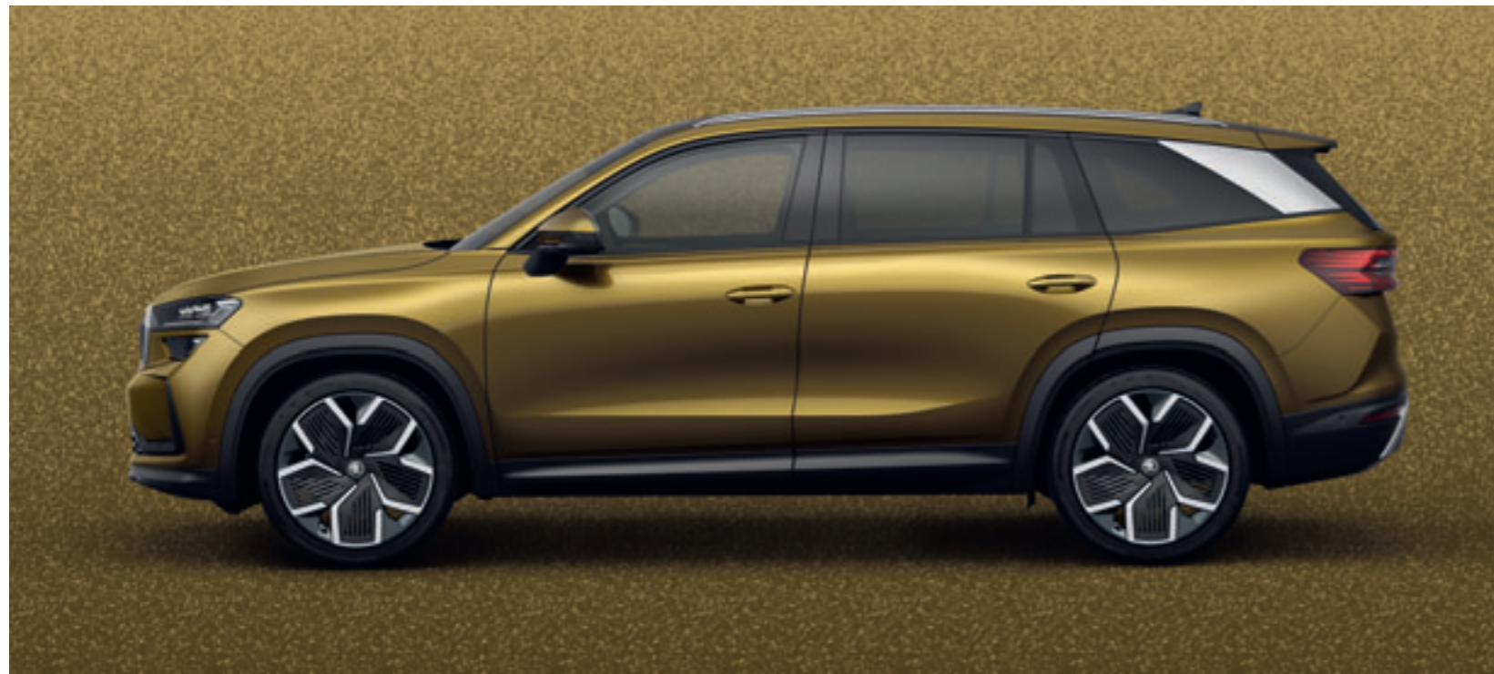
Zlatá Bronx metalíza