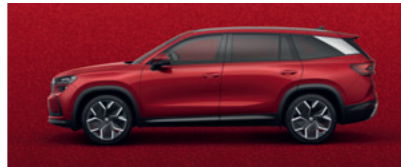
Červená Velvet metalíza