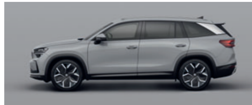
Sivá Steel Uni