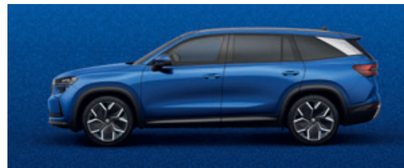
Modrá Race metalíza