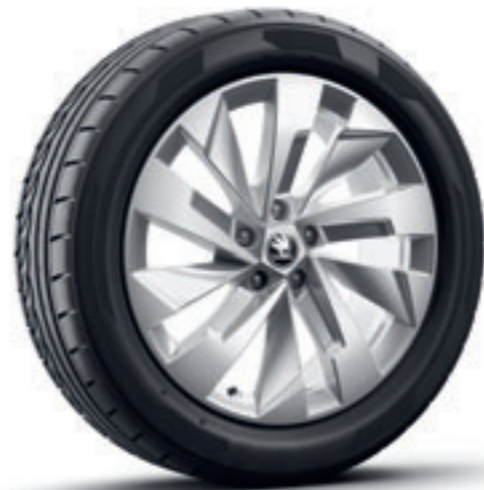
Strieborné 19" disky Rapeto Aero z ľahkej zliatiny