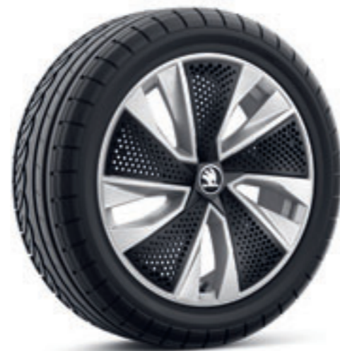
Strieborné 17" disky Kajam z ľahkej zliatiny s čiernymi krytmi Aero