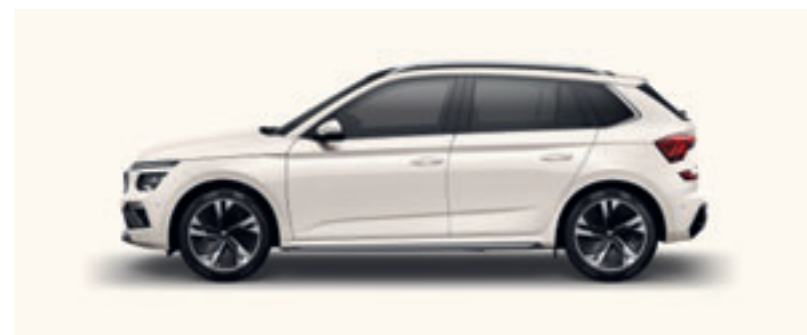
Biela Candy uni