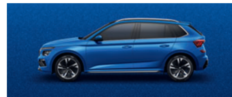
Modrá Race metalíza