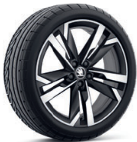
Leštené čierne 18" disky Ursa z ľahkej zliatiny*