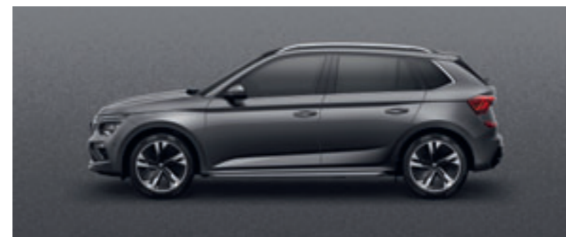
Sivá Graphite metalíza