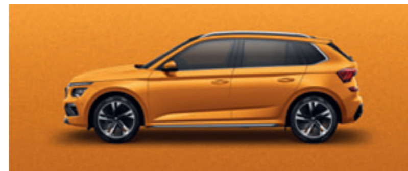
Oranžová Phoenix metalíza