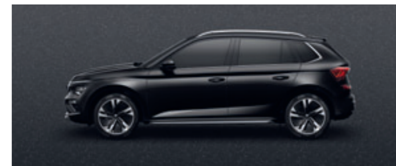
Čierna Magic metalíza