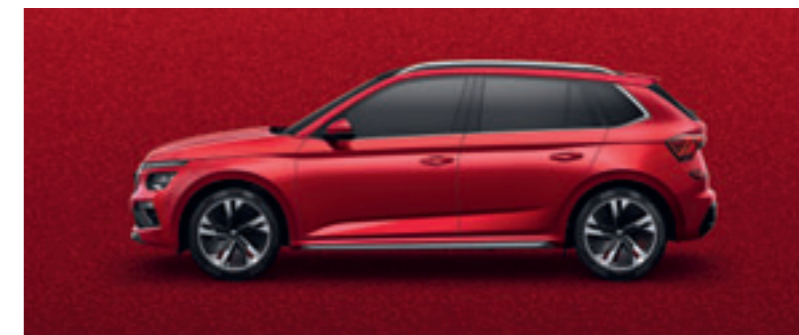
Červená Velvet metalíza