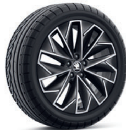
Leštené čierno-sivé 17" disky Propus Aero z ľahkej zliatiny