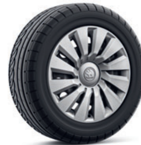
16" oceľové disky s krytmi kolies Tecton