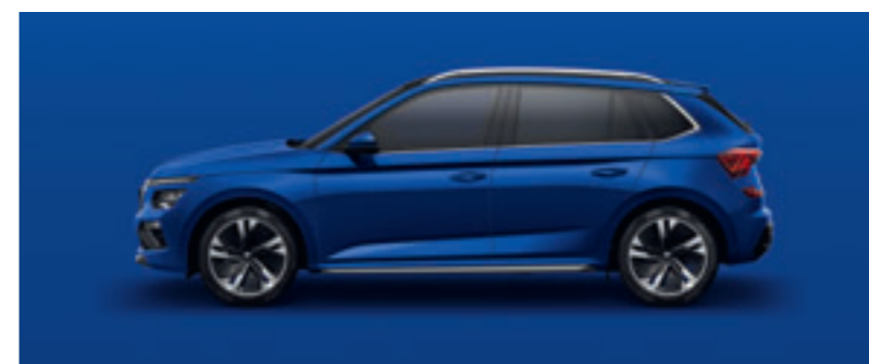
Modrá Energy Uni