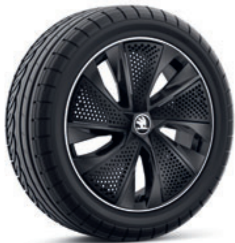
Čierne 17" disky Kajam z ľahkej zliatiny s čiernymi krytmi Aero*