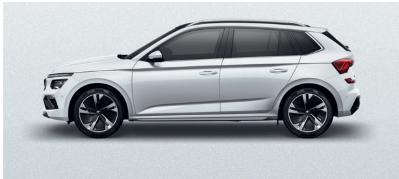
Biela Moon metalíza