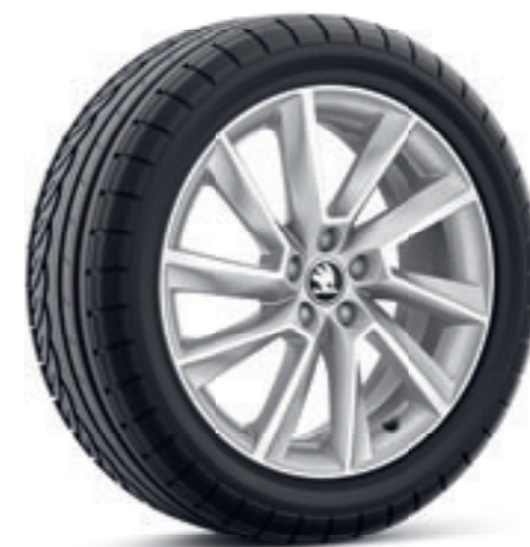
Strieborné 17" disky Stratos z ľahkej zliatiny