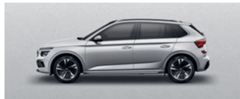
Strieborná Brilliant metalíza