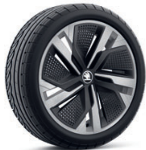
Strieborné 18" disky Ursa z ľahkej zliatiny s čiernymi krytmi Aero