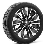
Alkaris 17" čierne leštené