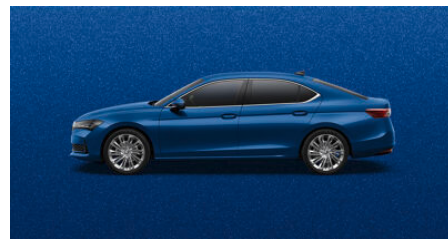
Modrá Cobalt, metalická