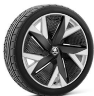
Aniara 19" striebové s aero krytmí