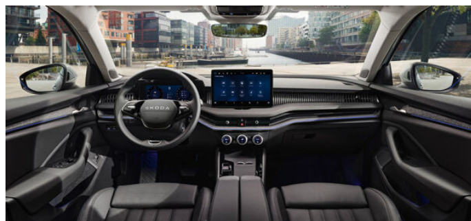
Suite v čiernej farbe