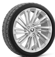
Veritate 19" striebové