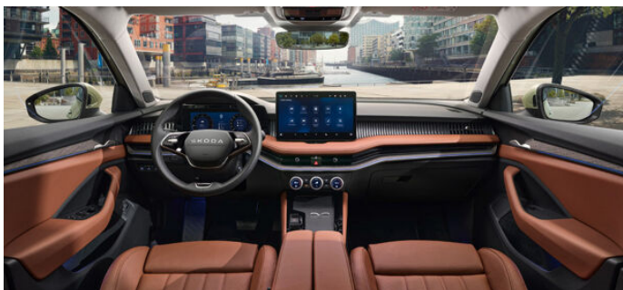
Suite vo farbe Cognac