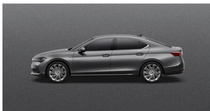
Sivá Graphite, metalická