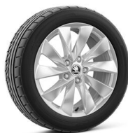
Mintaka 17" striebové