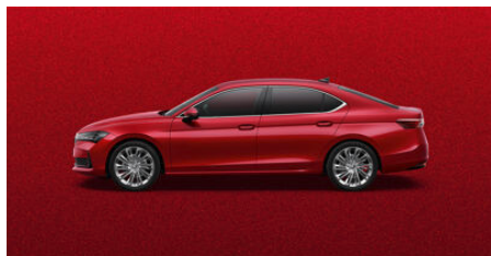
Červená Carmine, metalická