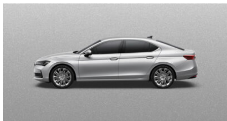
Strieborná Pebble, metalická