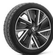
Vela 18" antracitové