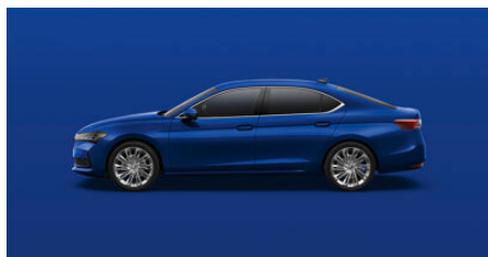
Modrá Energy, uni