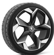
Torcular 19" čierne leštené