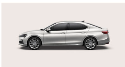
Biela Purity, uni