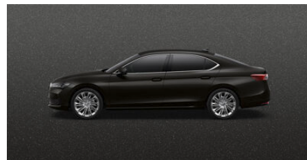
Čierna Ebony, metalická