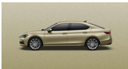
Žltá Ice Tea, metalická