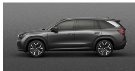
Sivá Graphite, metalická