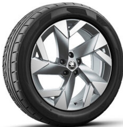
Tirsuli 19" antracitové