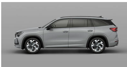
Šivá Steel, uni