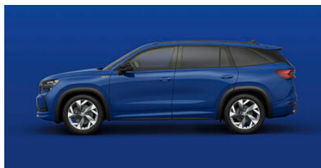
Modrá Energy, uni