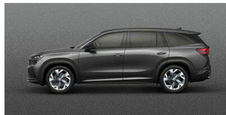
Šivá Graphite, metalická