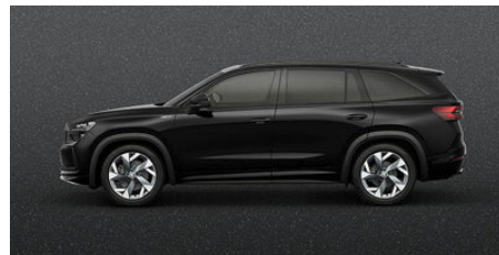
Čierna Magic, metalická