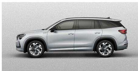
Strieborná Brilliant, metalická