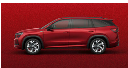
Červená Velvet, metalická