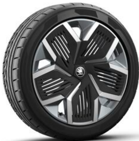
Rila 20" antracitové s aero krytmi