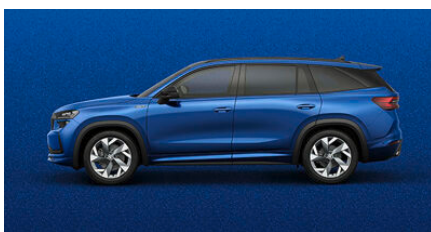
Modrá Race, metalická