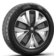
Talgar 19" strieborné s aero krytmi