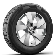
Paget 17" strieborné