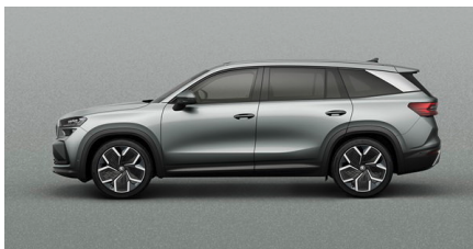
Stříborná Smokey Diamond, metalická