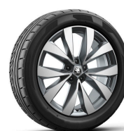
Lefka 19" antracitové