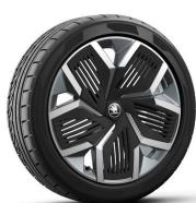
Rila 20" antracitové s aero krytmi