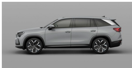
Sivá Steel, uni