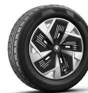
Mazeno 18" strieborné s aero krytmi