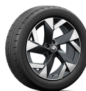
Tirsuli 19" čierne (len pre Sportline)