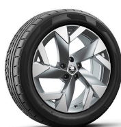
Tirsuli 19" antracitové (len pre Sportline)