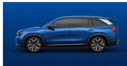
Modrá Race, metalická