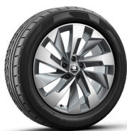
Halti 19" antracitové