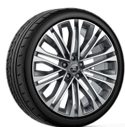
Venus 20" antracitové