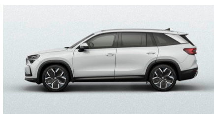
Biela Moon, metalická