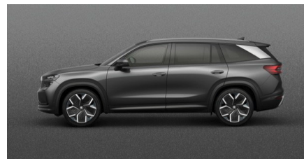
Šedá Graphite, metalická