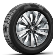
Soira 18" antracitové