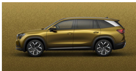
Zlatá Bronx, metalická