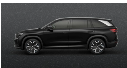
Čierna Magic, metalická