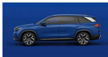
Modrá Energy, uni