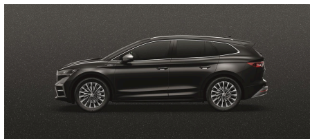
Čierna Magic, metalická