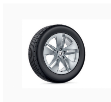
Proteus 19" strieborná