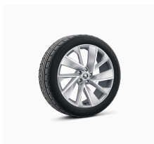
Vega 20" strieborné leštené