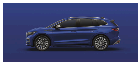
Modrá Energy, uni