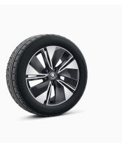
Regulus 19" antracitové