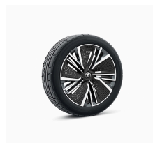
Neptun 20" antracitové s aero krytmí