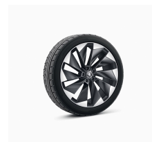
Supernova 21" strieborné leštené