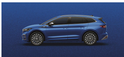
Modrá Race, metalická