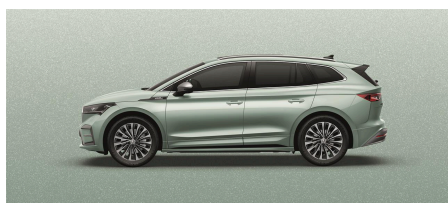
Strieborná Arctic, metalická