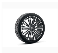
Aquarius 21" antracitové