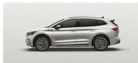
Biela Moon, metalická