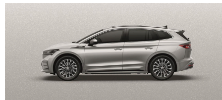
Strieborná Brilliant, metalická