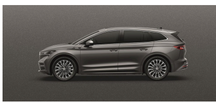
Sivá Grafit, metalická