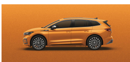
Oranžová Phoenix, metalická