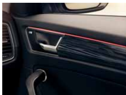
Červené ambientné osvetlenie