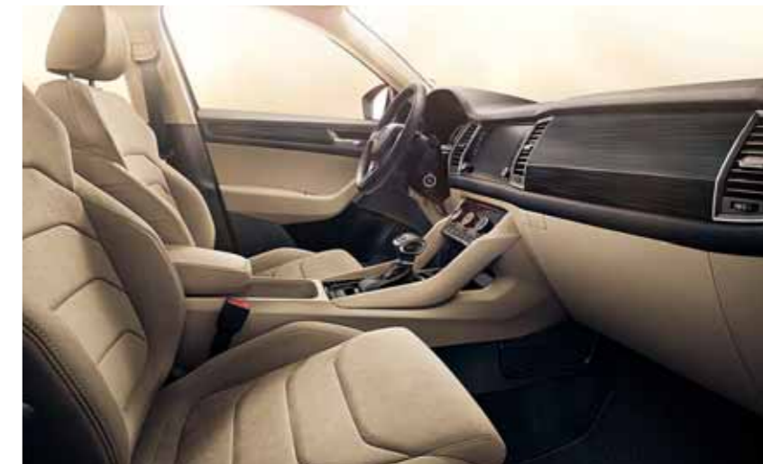
INTERIÉR STYLE ČIERNY / BÉŽOVÝ Dekor Waves