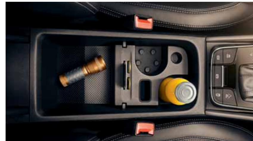
JUMBO BOX Priestranný úložný priestor sa nachádza v prednej laktovej opierke. Môžete doň bezpečne uložiť elektroniku alebo chladené potraviny, takže ostanú dlhšie čerstvé. Jumbo Box môže byť vybavený aj držiakmi na nápoje.