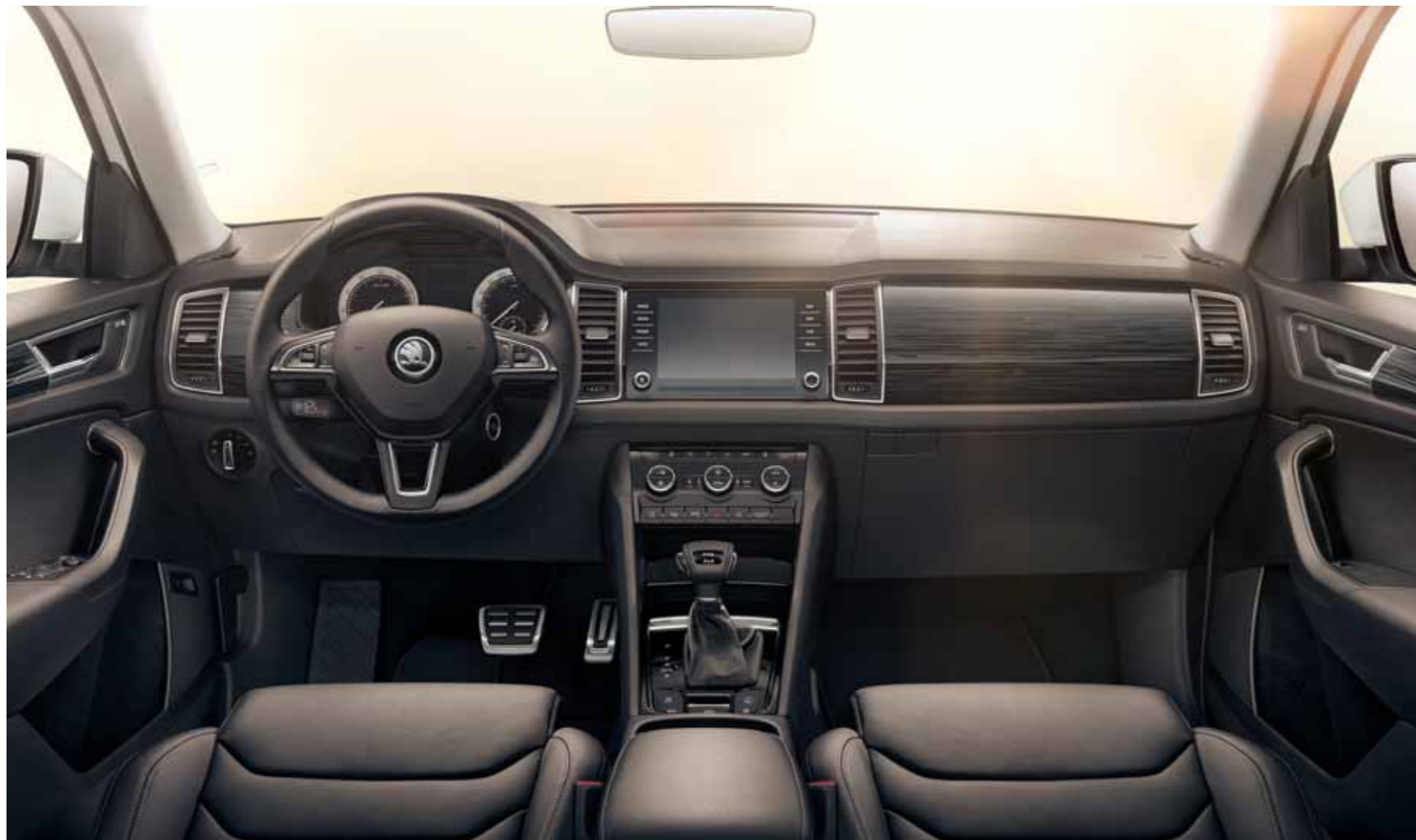
INTERIÉR STYLE ČIERNY Dekor Mythos Glossy Black