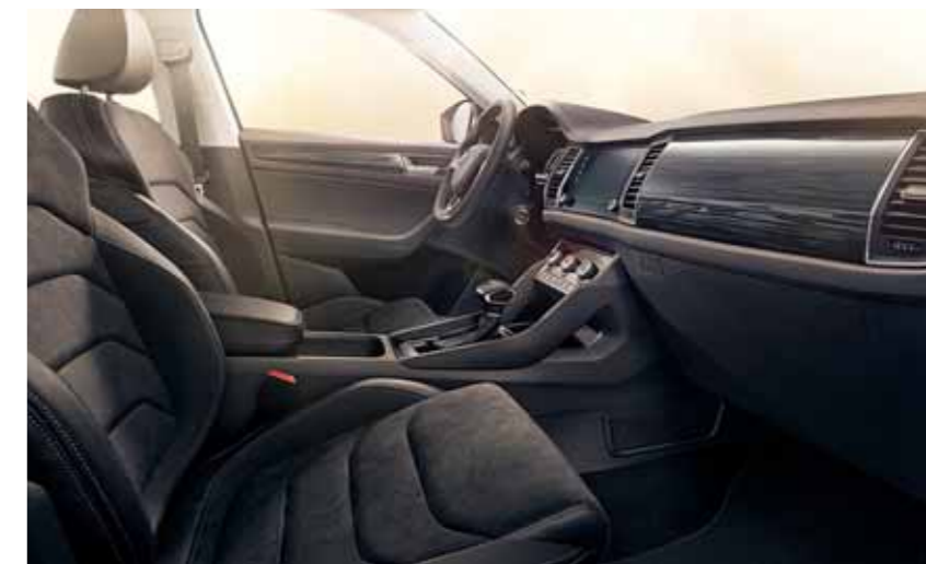
INTERIÉR STYLE ČIERNY Dekor Mythos Glossy Black