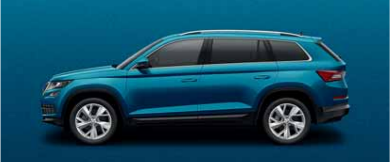
MODRÁ LAVA METALÍZA