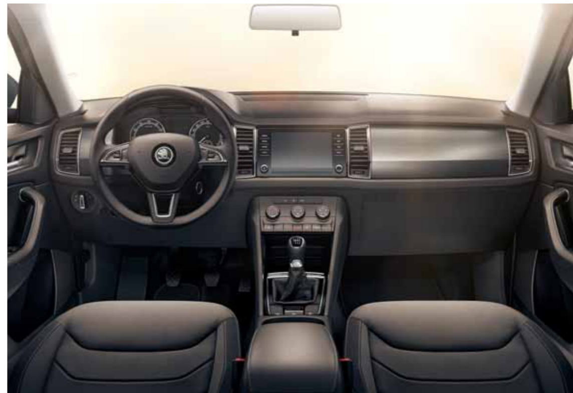
INTERIÉR AMBITION ČIERNY Dekor Anthracite Light Brushed