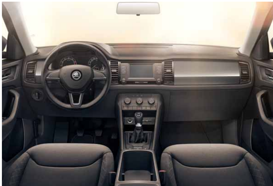
INTERIÉR ACTIVE ČIERNY Dekor Nano Grey Metallic