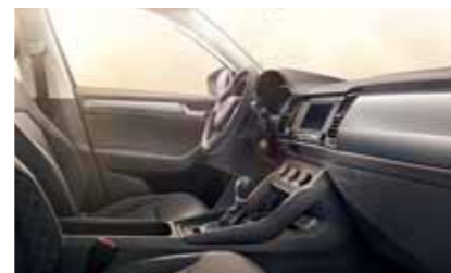
INTERIÉR ACTIVE ČIERNY Dekor Nano Grey Metallic