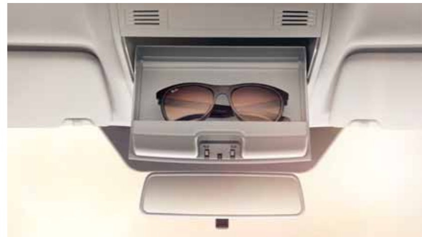
PRIESTOR NA SLNEČNÉ OKULIARE Táto praktická priehradka nad vnútorným spätným zrkadlom je na dosah ruky vodiča aj spolujazdca.