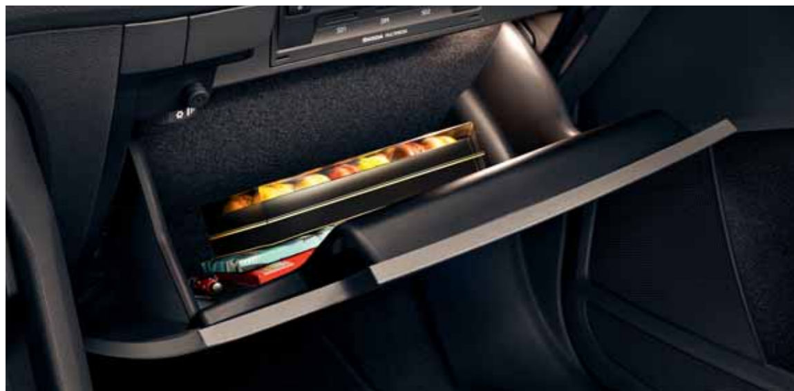
SPODNÁ ÚLOŽNÁ PRIEHRADKA Uzatvratelná vyklápací úložná priehradka v dolnej časti prístrojovej dosky pred spolujazdcom môže byť klimatizovaná, aby ste do nej mohli na cestách odložiť chladené potraviny pre deti.