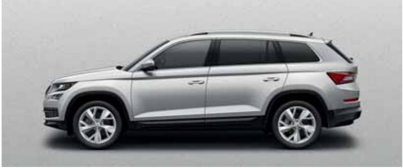
STRIEBORNÁ BRILLANT METALÍZA