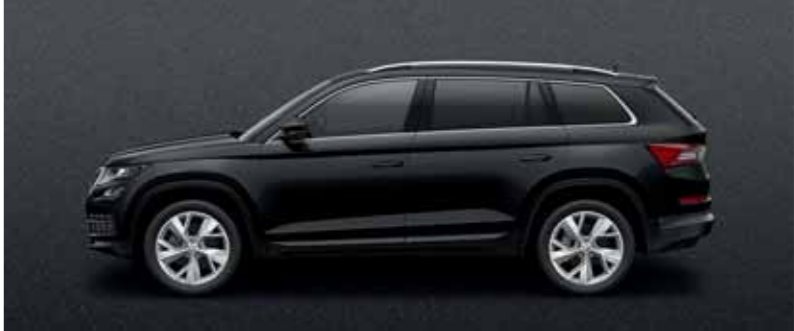
ČIERNÁ MAGIC METALÍZA