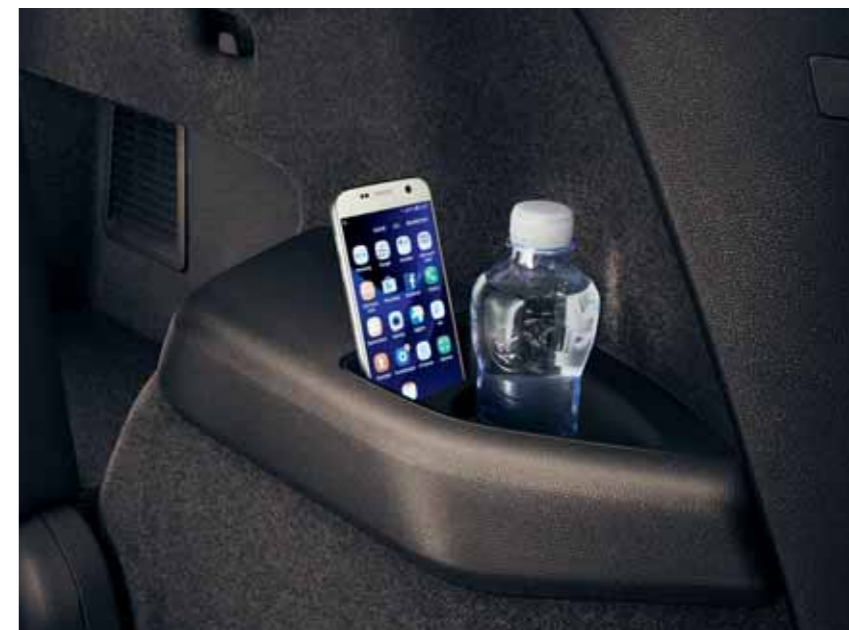
DRŽIAKY NA FĽAŠE A NA MOBILNÉ TELEFÓNY Nezabudli sme ani na pohodlie cestujúcich na sedadlách v tretom rade. Ocenia držiaky v bočnom kryte batožinového priestoru.