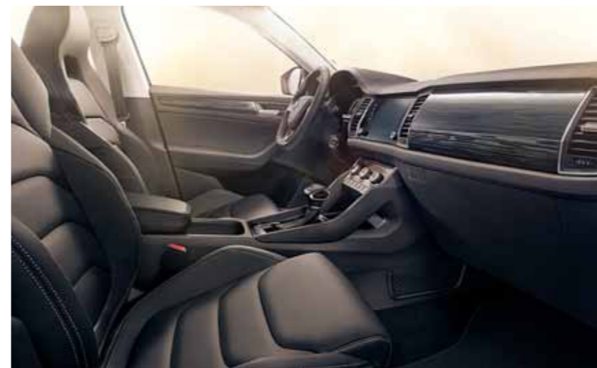
INTERIÉR STYLE ČIERNY Dekor Mythos Glossy