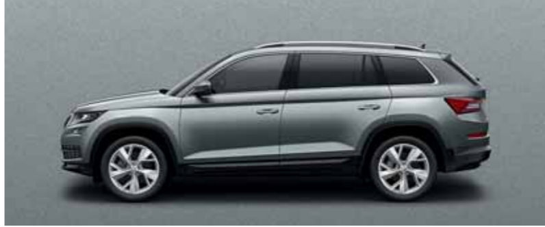
SIVÁ BUSINESS METALÍZA