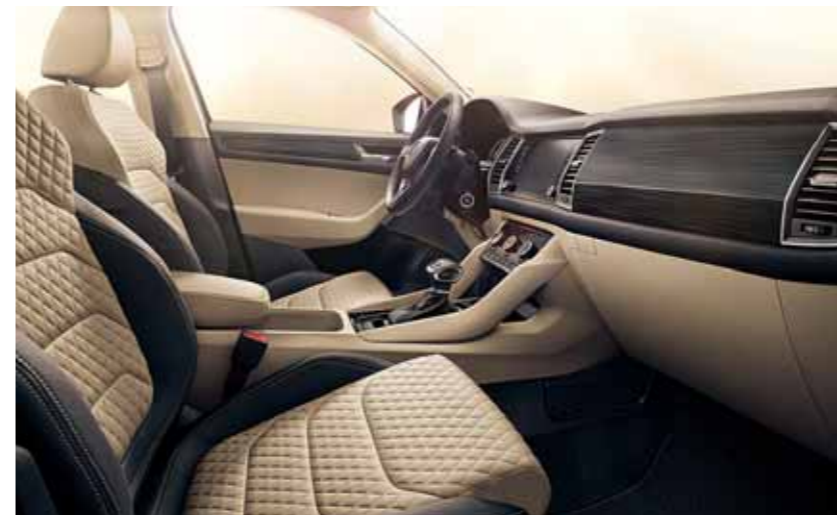
INTERIÉR STYLE ČIERNY / BÉŽOVÝ Dekor Waves