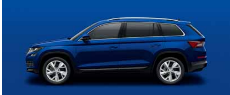
MODRÁ ENERGY UNI