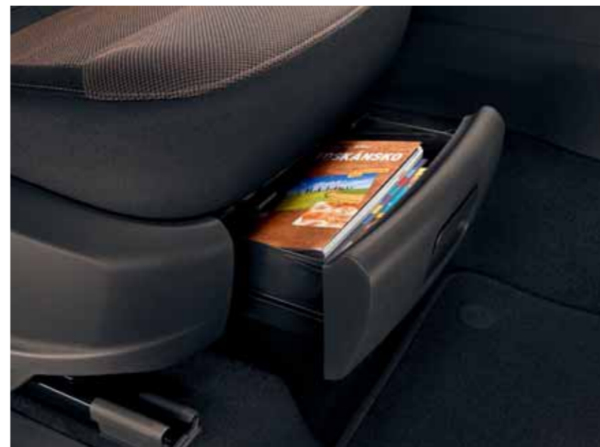
ZÁSUVKY POD PREDNÝMI SEDADLAMI Skrýty úložný priestor na rôzne drobnosti sa nachádza pod sedadlami vodiča a spolujazdca. V ponuke je pre vozidlá s manuálne nastaviteľnými sedadlami.