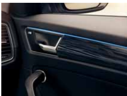
Modré ambientné osvetlenie