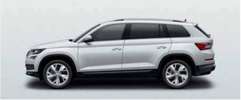
BIELA MOON METALÍZA