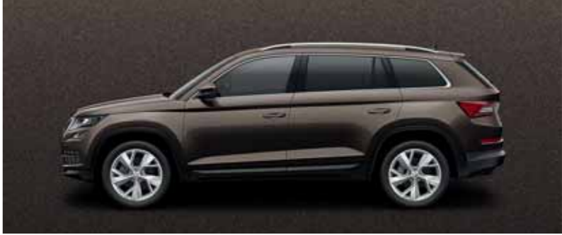
HNEDÁ MAGNETIC METALÍZA