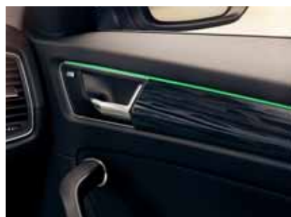
Zelené ambientné osvetlenie

Diskrétné osvetlenie dodá priestoru výnimočnosť. Doprajte si maximálny komfort s osvetlením interiéru a počas jazdy si užívajte diskkrétne osvetlené prostredie.