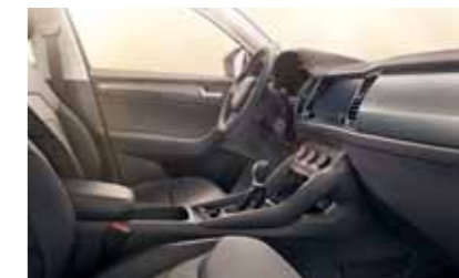
INTERIÉR AMBITION ČIERNY Dekor Anthracite Light Brushed