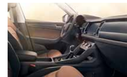
INTERIÉR AMBITION ČIERNY / HNEDÝ Dekor Mistral