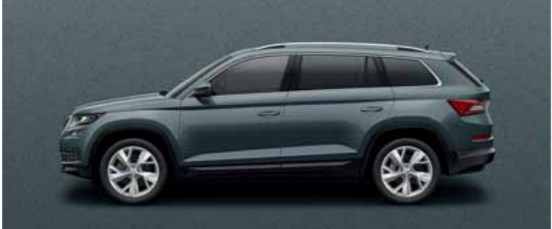
SIVÁ QUARTZ METALÍZA