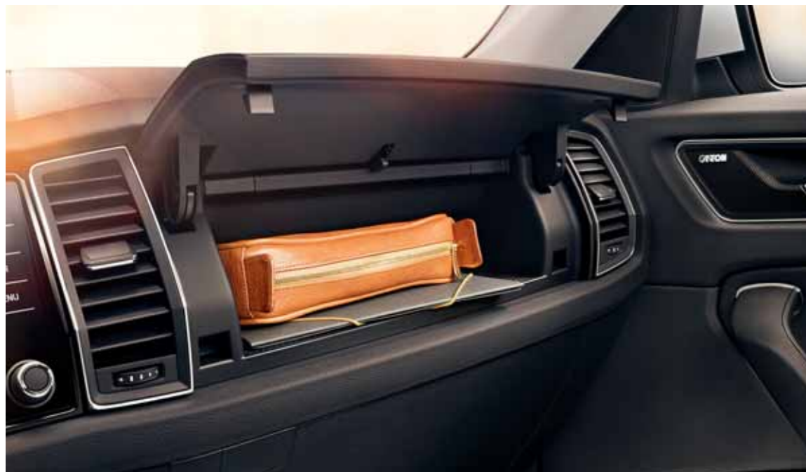
PRIEHRADKA PRED SPOLUJAZDCOM Objavte tento prekvapivo veľký úložný priestor s uzatvárateľným vekom v hornej časti palubnej dosky pred spolujazdcom.