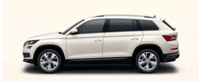
BIELA CANDY UNI