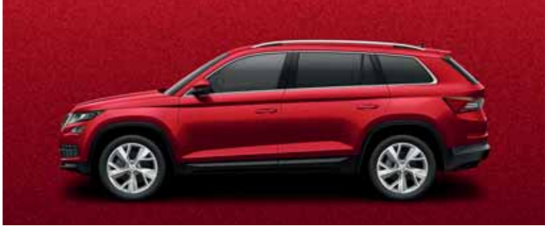
ČERVENÁ VELVET METALÍZA